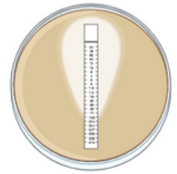
CUANTITATIVO (CMI-Conc. Mín. Inhib.)

Tarifa 2025: 4,00 € importe fijo + 0,60 € / antibiótico